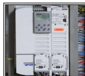
AC SERVO ENHET